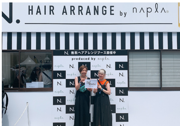
サマソニック 無料ヘアアレンジブース

新しい仲間が入って来ても、しっかりとフォローが出来る環境です。技術に不安のある方には講習会以外にも、各スタイリストがマンツーマンで技術指導致します。